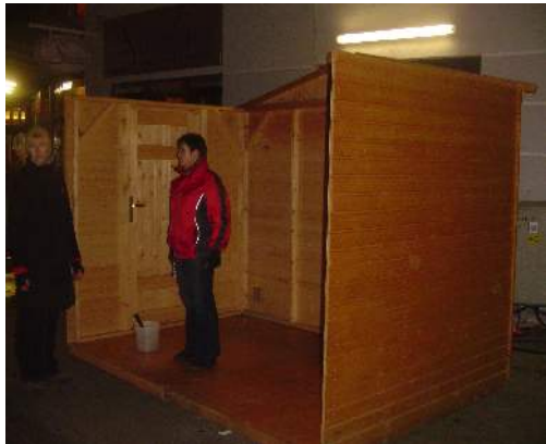
Abbildung 7: Innenansicht

Die Tür kann rechts und links angebracht werden.