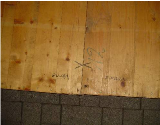
Abbildung 3: Bodenplatten mit Kennzeichnung