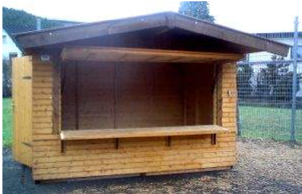
Abbildung 8: Verkaufsklappe mit Gasdruckfedern

Die Holzhäuser haben eine Grundfläche von 2 m x 3 m und sind stabil gebaut.