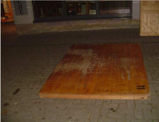
Abbildung 1: Bodenplatte 1 von 2

Beim zusammensetzen ist darauf zu achten, dass der Untergrund eben ist und die Markierungen übereinstimmen.