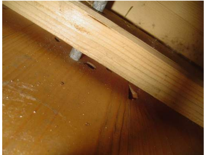
Abbildung 5: Bodenbolzen

Die Wände werden ebenfalls mit Bolzen gegen Verrutschen gesichert