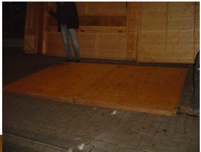
Abbildung 2: Ausrichtung der Bodenplatten

Der Boden besteht aus 2 Einzelteilen, die mit Nut und Feder verbunden werden.