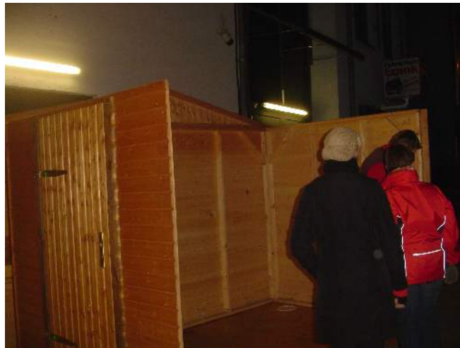
Abbildung 6: Die Tür