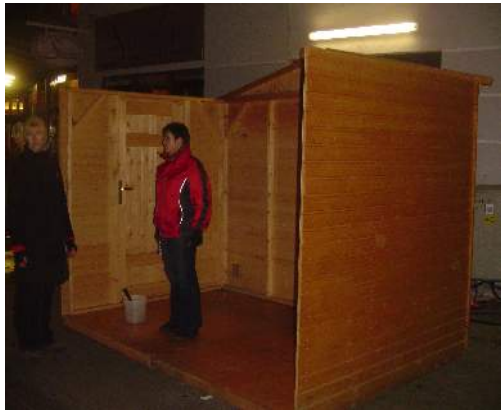
Abbildung 7: Innenansicht

Die Tür kann rechts und links angebracht werden.